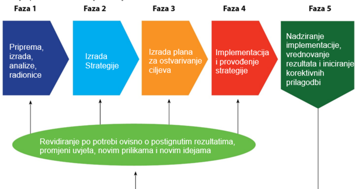
Slika 3 Područja rizika u implementaciji Strategije upravljanja imovinom

Gore navedeno treba biti usklađeno s procesima stvaranja i implementacije Strategije, kako je prikazano na sljedećoj slici.