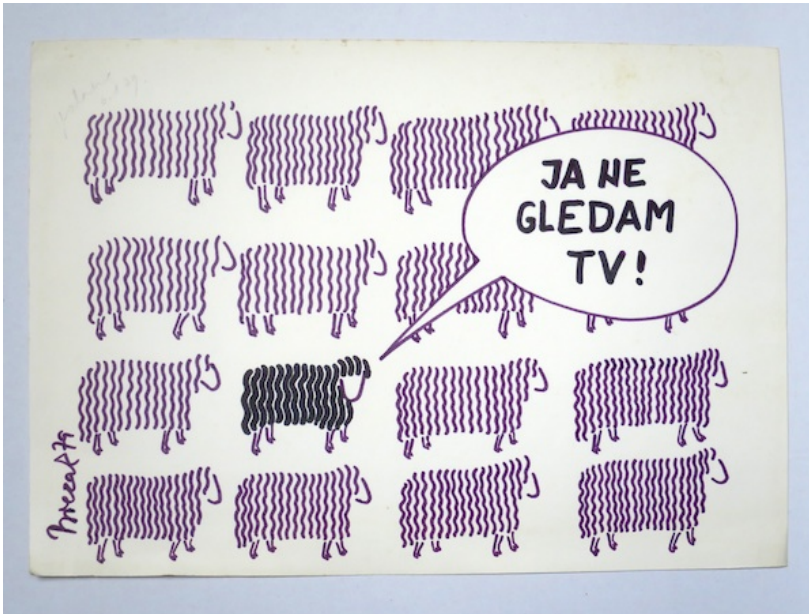
Karikatura za natječaj, "Studio", broj 772. od 20.1. do 26.1.1979., str. 81.